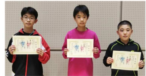
6年男子シングルス