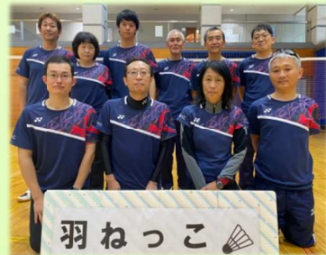
羽ねっこコーチの皆さん

ジュニアバドミントン教室「羽ねっこ」は、小学生を対象に毎月第3土曜日を基本に月1回、静岡市東部体育館を主会場に行っています。午前、午後の2部制で、午前の部を初心者、午後の部を経験者対象に募集しています。バドミントン競技への関心は高く、元年度後期には、静岡市を中心に多くの小学校から約90名の参加者が集まりました。