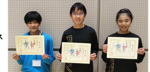
6年女子シングルス