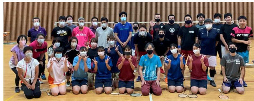
コーチ2養成講習会参加者の皆さんと 指導実践の為に選手の皆さん