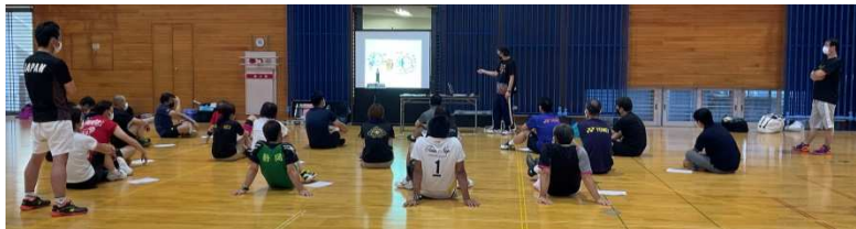
コーチ1養成講習会風景

例年は有資格が自己研鑽の為に参加しご協力をお願いしておりましたが、コロナ感染症対策に伴い本年度は控えさせていただきました。内容は、多岐にわたり抜粋し掲載いたします。