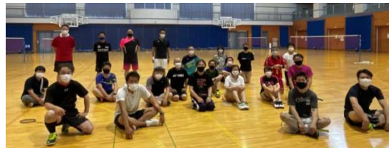
コーチ1養成講習会参加者の皆さん

コーチ1は、「バドミントンの指導理論・トレーニング理論・スポーツ心理学・バドミントンの歴史など」を御教授頂きました。