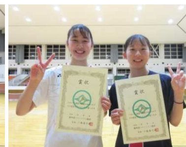
一般男女ダブルス 優勝者