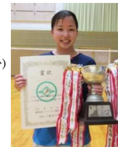
初心者男女シングルス優勝者