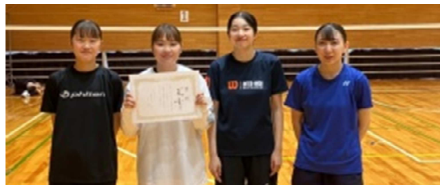
女子1部1位: 常葉大学浜松キャンパス A チーム