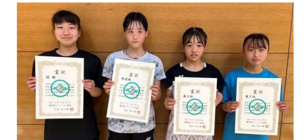
1位から3位の皆さん