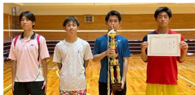
男子1部1位: 静岡大学静岡キャンパス A チーム