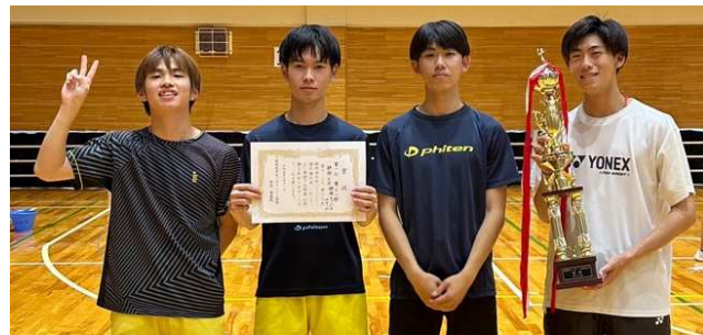
男子1部1位: 静岡大学静岡キャンパス A チーム