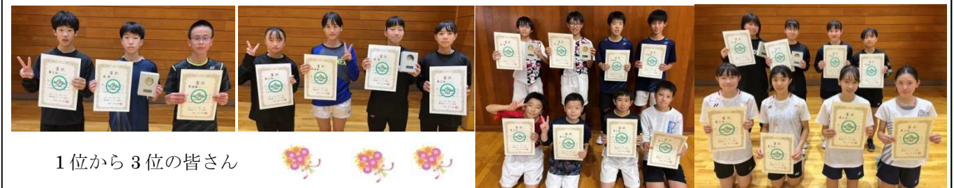
1位から3位の皆さん