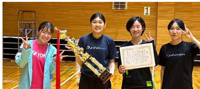
女子1部1位: 静岡大学静岡キャンパス A チーム